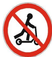
Рисунок 9. Дорожный знак 3.35 «Движение лиц на средствах индивидуальной мобильности, запрещено»

Мы катаемся на скейтах, Роликах и самокатах, Гироскутерах, моно-колесах. А по правилам, ребята? Мы должны понять, что СИМы – Средства транспортные тоже! Знание правил их вождения. Жизни сохранить поможет!